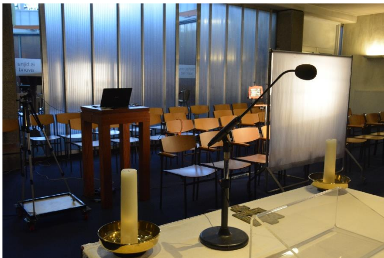
Gebruik van een schijnwerper en laken

Er is een interface aangeschaft die het mogelijk maakt om de laptop die gebruikt wordt voor het opnemen aan te sluiten aan de bestaande geluidsinstallatie. Verder heeft Niels Vrolijk het raamwerk verzorgd dat het mogelijk maakt om de beelden en het geluid vanuit de kapel via YouTube in de huiskamer te krijgen.